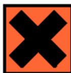
Xn – Ártalmas