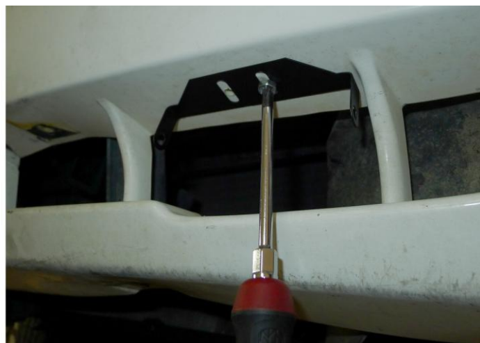
8. FÚRJA KI A HELYÉT