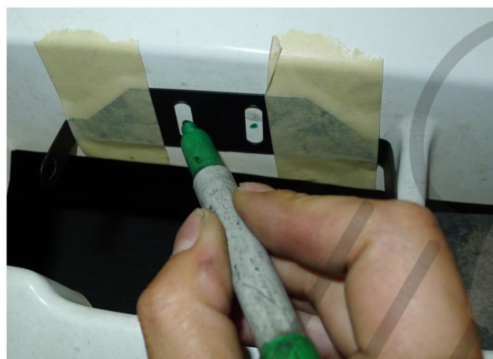
9. ALAKÍTSA KI A CSAVARHOZ