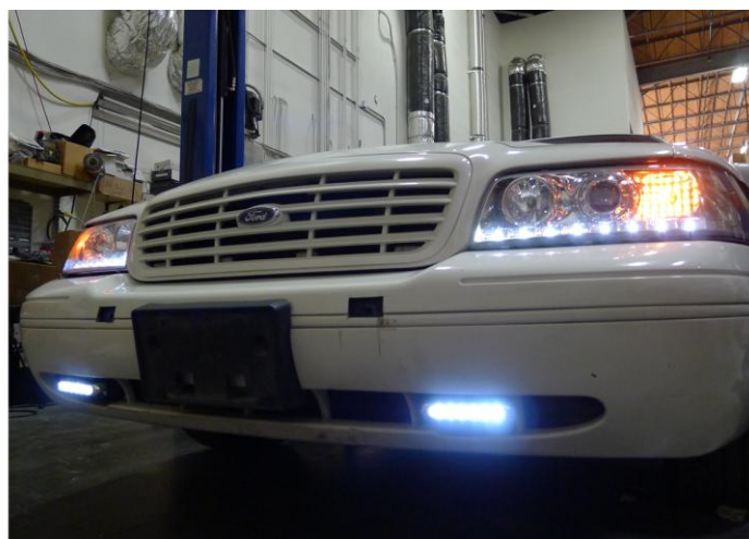
16. Az összeszerelés kész