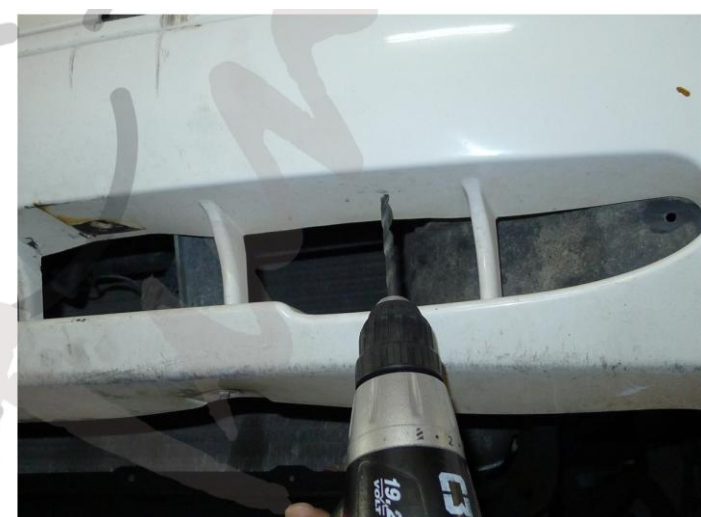
10. RÖGZÍTSE A KONZOLT CSAVAROKKAL