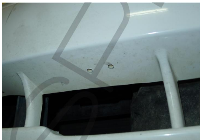
7. JELÖLJE BE A FURAT HELYÉT