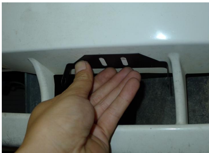
5. ILLESSZE A HELYÉRE A KONZOLT