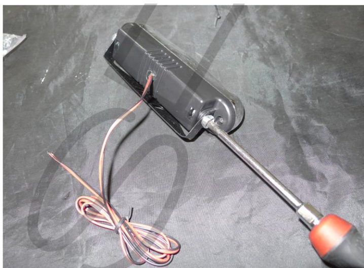
3. VEGYE LE A KONZOLT A DRL-RŐL