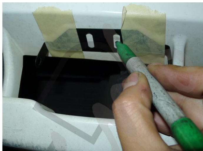
6. RÖGZÍTSE A HELYÉT