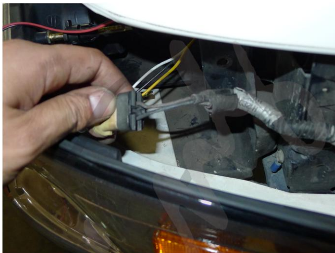
12 . Illessze be a mérethez illő negatív és pozitív vezetéket