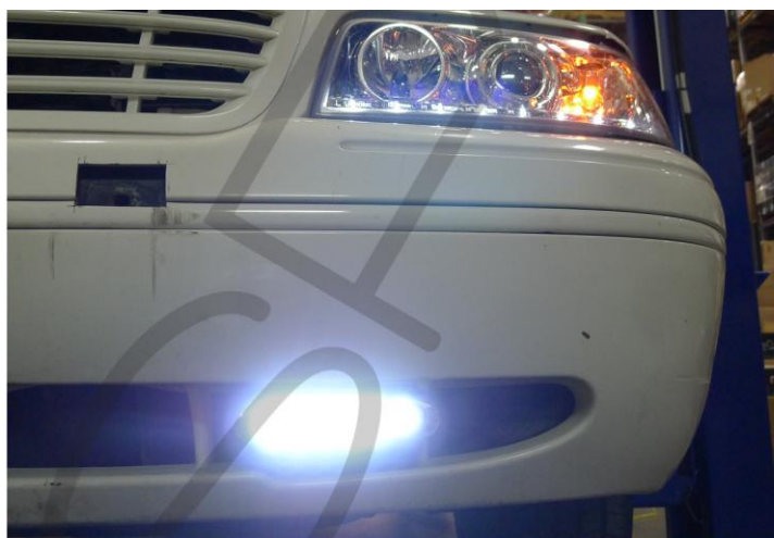
15. Tesztelje a működést Ismételje meg az 1-15 pontokat a másik oldalon