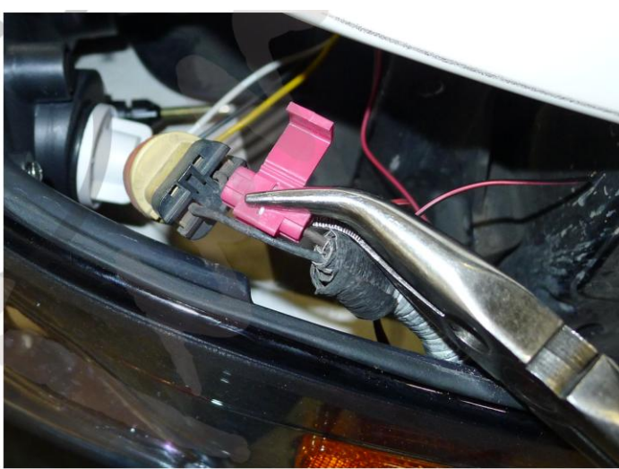
14. Illessze össze a DRL vezetéket a 12V-os pozitív vezetékkel