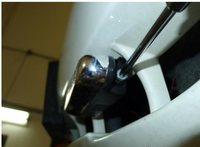
11. Rögzítse a DRL-t a konzolhoz