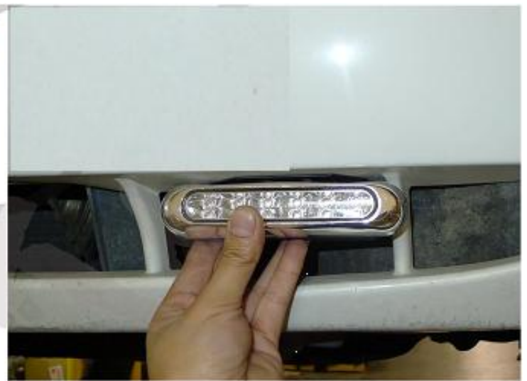
2. ALKALMAS TERÜLET KIVÁLASZTÁSA